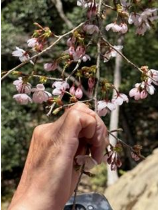
クマノザクラ(花柄は短い)