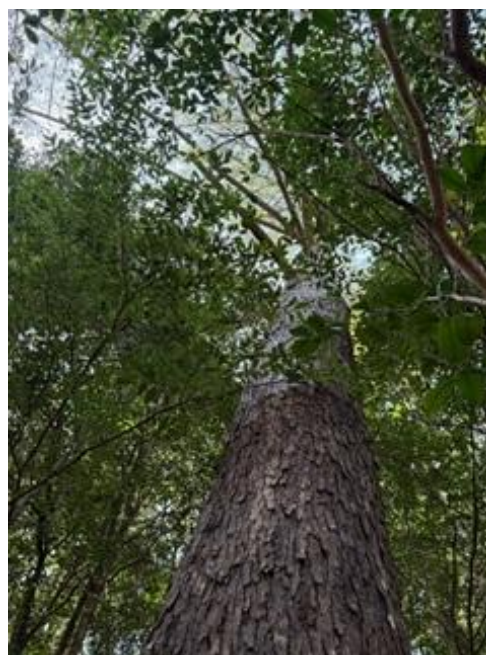
トガサワラ の 大木