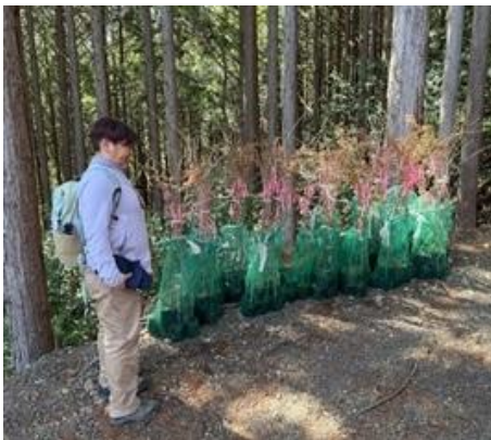
クマノザクラの苗木(3~4年)