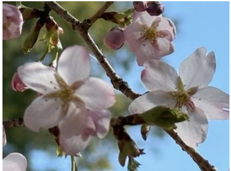
花の色はソメイヨシノより少し濃い