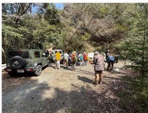
水上自然林出発点