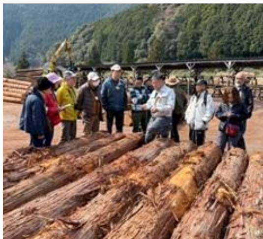
木材の説明（真砂組合長）