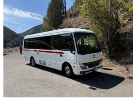
2日間お世話になったバス

JR 和歌山駅に集合、マイクロバスで龍神村まで移動。山また山そして溪流の紀伊山地を2時間かけて龍神村に到着。標高600mを超える山の斜面を歩いて、クマノザクラの観察と植樹を実施。