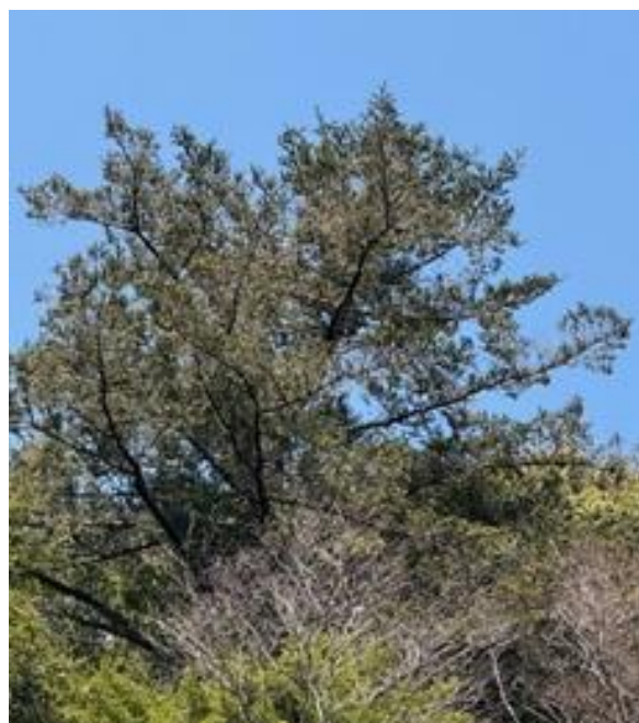
トガサワラ 樹形（枝が横に張り出す）